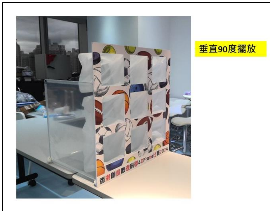
圖 2 - 任務區 桌子說明 - 九宮格的固定方式