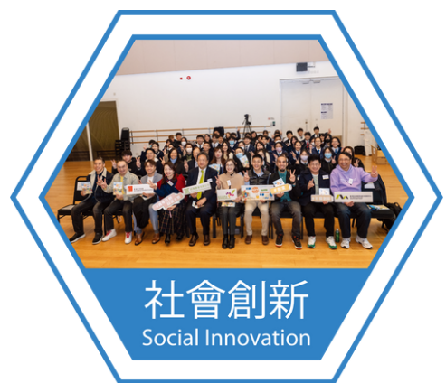
社會創新 Social Innovation

「M21數碼媒體新體驗旅程」目的是讓學員從理論到實踐，透過參與不同數碼媒體工作坊及角色體驗，從而深入了解不同媒體背後有趣的製作過程，並發掘自己對媒體的興趣和潛質。