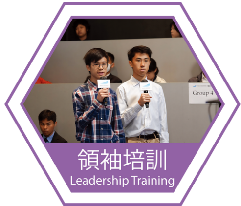
領袖培訓 Leadership Training