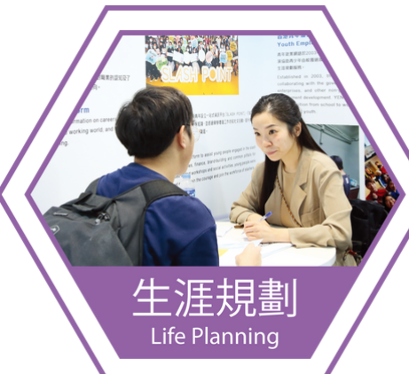
生涯規劃 Life Planning