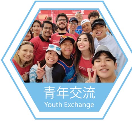
青年交流 Youth Exchange