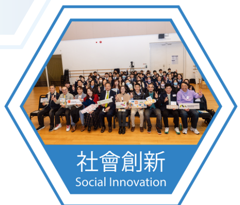
社會創新 Social Innovation