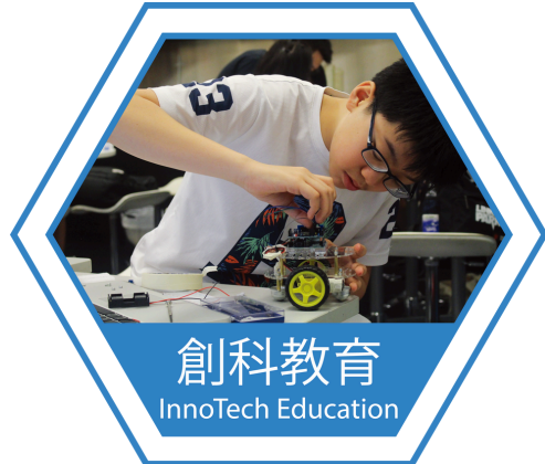
創科教育 InnoTech Education

Nurturing Young Talent and Navigating Digital Transformation