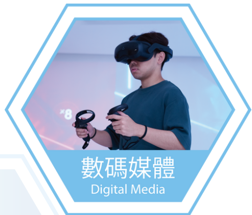
數碼媒體 Digital Media